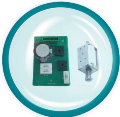
Расцепитель min напряжения