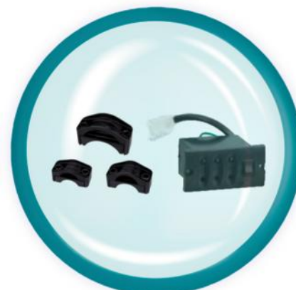
Зажимы. Датчик индикации